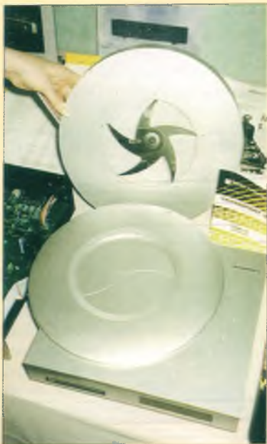
Новая модель CD-транспорта фирмы Sonic Frontiers готова отстаивать свое достоинство в грядущей битве с DVD

Совсем недавно мы сделали наш первый Surround Sound процессор. Во всех случаях осуществлялись, как правило, совместная выработка концепции продукта, взаимодействие при его разработке, а затем изготовление его по специальному заказу наших фирм-партнеров.