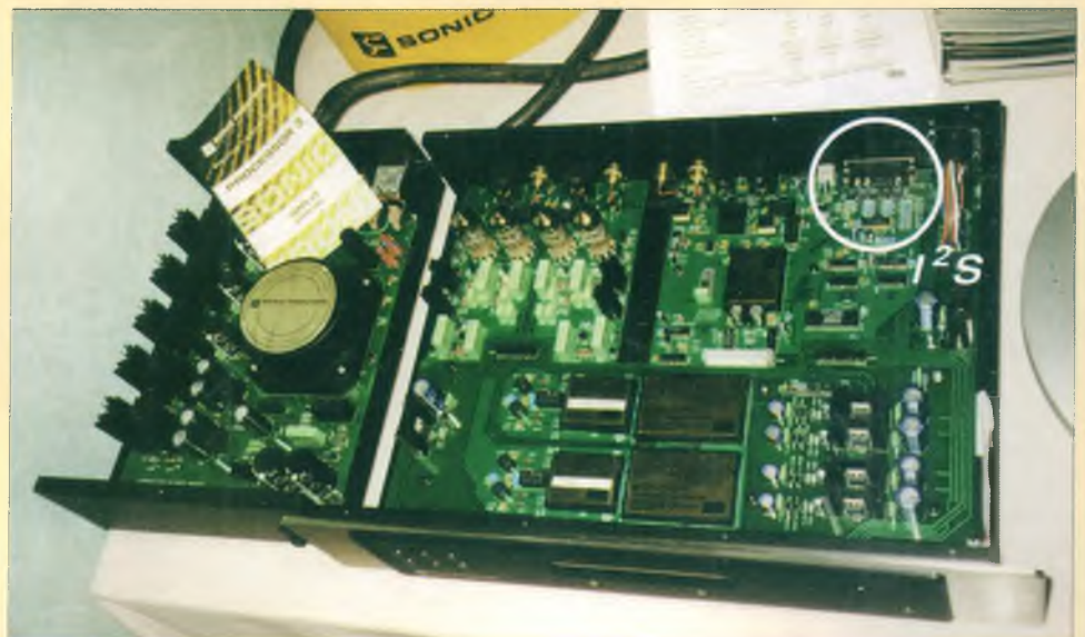
Новые цифровые аудиокомпоненты фирм Krell и Sonic Frontiers с цифровым интерфейсом I 2 S

сопоставление транспорта С.Е.С. TL-1, который есть пример прецизионной механики, с транспортом Sonic Frontiers SFT-1, весьма посредственно выполненного с этой точки зрения и имеющего типовой транспортный механизм Philips. Если снятый плохим звукоснимателем аналоговый сигнал не подлежит восстановлению, то в цифровой технике возможно его улучшение в цифре. В результате качество цифровой электроники транспорта Sonic Frontiers победило прецизионную механику С.Е.С. TL-1. Я знаю, что SFT-1 разрабатывался UltraAnalog. Как появилась идея нового подхода к конструированию цифрового