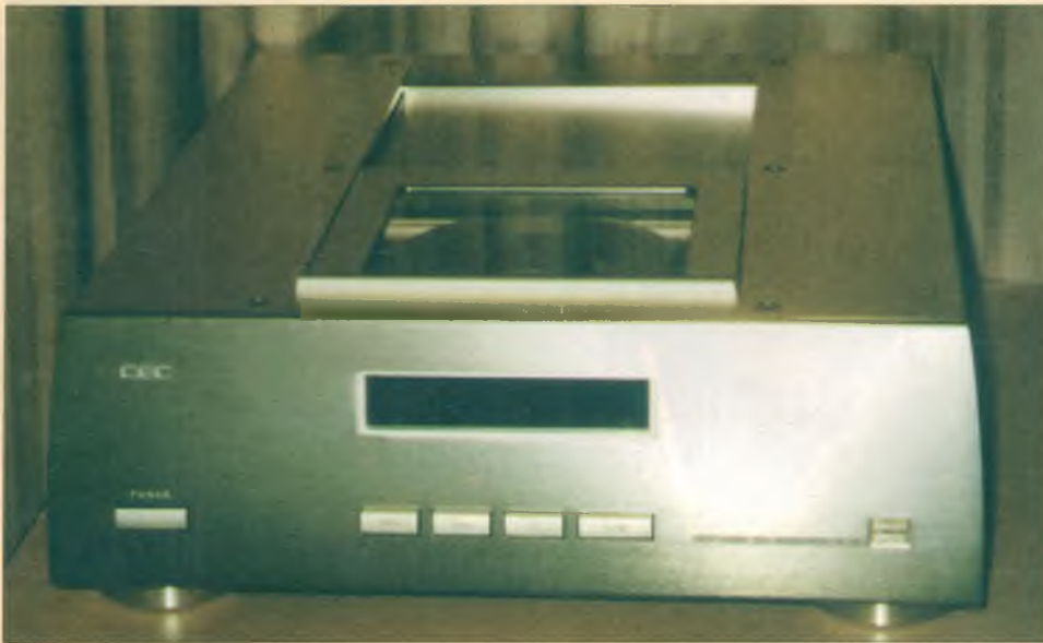
CD-транспорт С.Е.С. TL-1 с пассивным приводом японской фирмы CHUO DENKI

было принципом фирмы Sonic Frontiers, и в данном случае мы ориентировались на этот принцип. После некоторых раздумий мы выбрали транспортный механизм Philips CDM12.4. Это — достаточно дешевый пластмассовый механизм, хотя система оптики и сервоконтроля сделаны достаточно неплохо. Но по механическим параметрам он сильно уступает многим другим моделям, которые мы могли бы использовать. В то же время, он существенно дешевле их. Можно было вместе с механизмом закупать готовое сервоустройство, поставляемое в комплекте с ним. Однако мы решили сделать свою схему сервоконтроля. В процессе ее разработки нам уда-